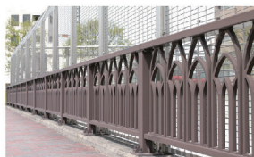
高欄 Bridge railings