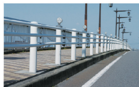
ガードパイプ Guard pipes